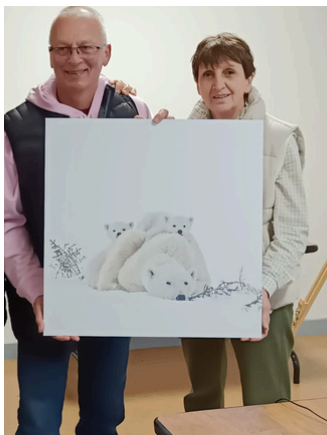
Lors de cette soirée, une photo a été offerte à notre partenaire Les Sablés de Nançay.

Enfin 4 conférences seront proposées aux visiteurs.